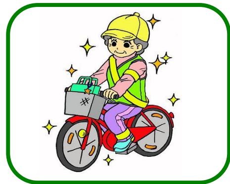
高齢者の自転車安全利用の推進