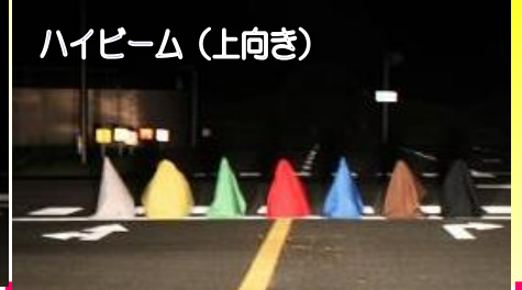
ハイビーム (上向き)