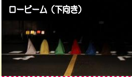
ロービーム (下向き)