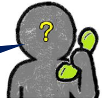
「ハウスメーカー」の ワダを名乗る男