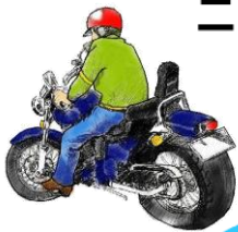
二輪車の交通事故 原因別死傷者数 (令和元年中)【県内】 死傷者数 293人

昨年、県内の二輪車乗車中の交通事故の死傷者数は293人で、そのうちの4割以上で何らかの違反が認められています。常に周囲の状況に注意を払い、安全な速度と方法で運転し、交通事故を防止しましょう。