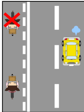
【駐停車禁止路側帯】