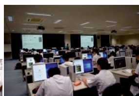
昨年度は1,300名の方に ご来場いただきました。